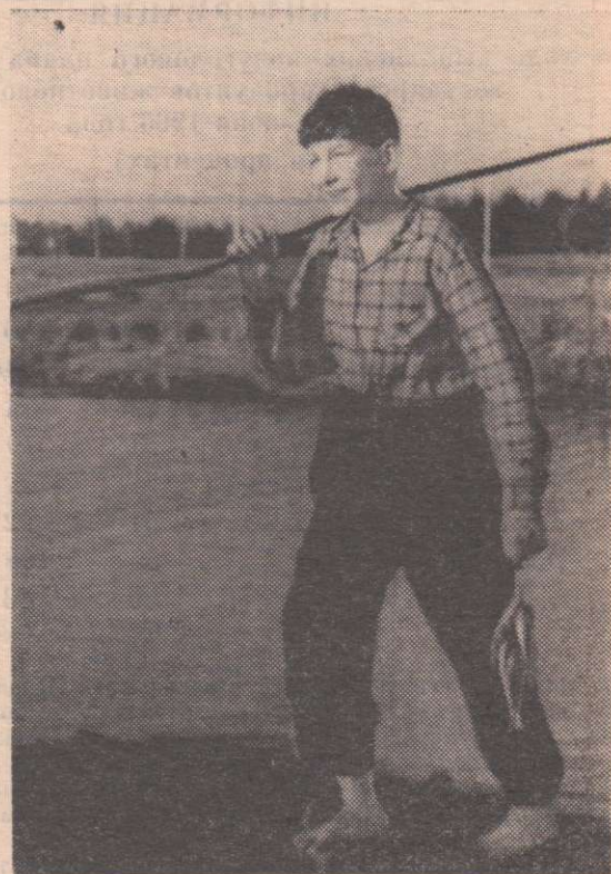
На уху хватит.